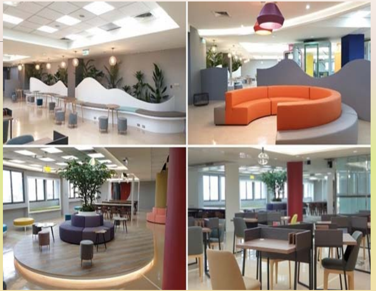
國璽樓五樓「Fun學趣—自學中心」