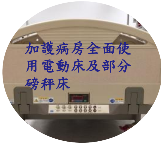
加護病房全面使用電動床及部分磅秤床